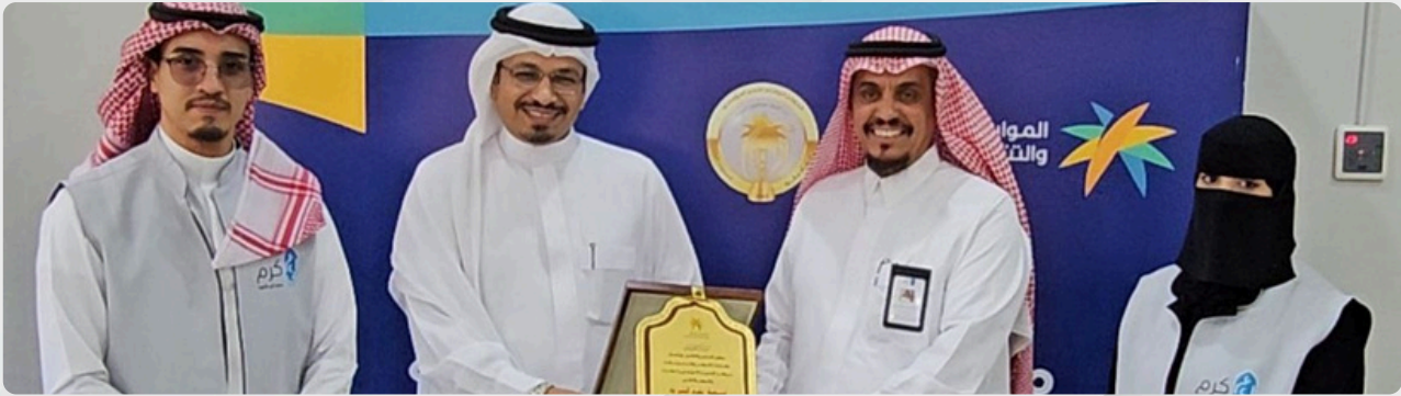
مركز التنمية بجدة يكرم جمعية كرم الأهلية تقديراً لتمييزها وجهودها البارزة في خدمة المجتمع في عام 2024.