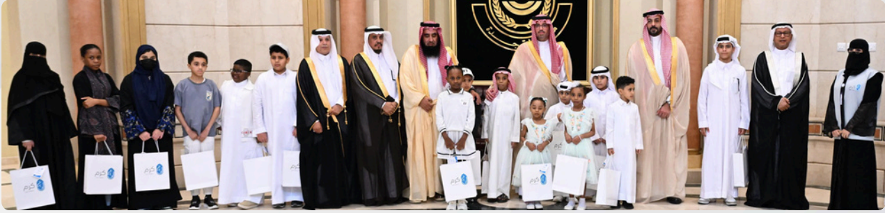
استقبل صاحب السمو الأمير سعود بن عبدالله بن جلوي محافظ جدة بمكتبه مجلس إدارة جمعية كرم الأهلية وأبناء كرم.