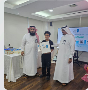
أقامت جمعية "كرم" حفل معايدة لأبنائها الأيتام بالشراكة مع منصة "إحسان" في أجواء أسرية مفعمة بالفرح والاهتمام.